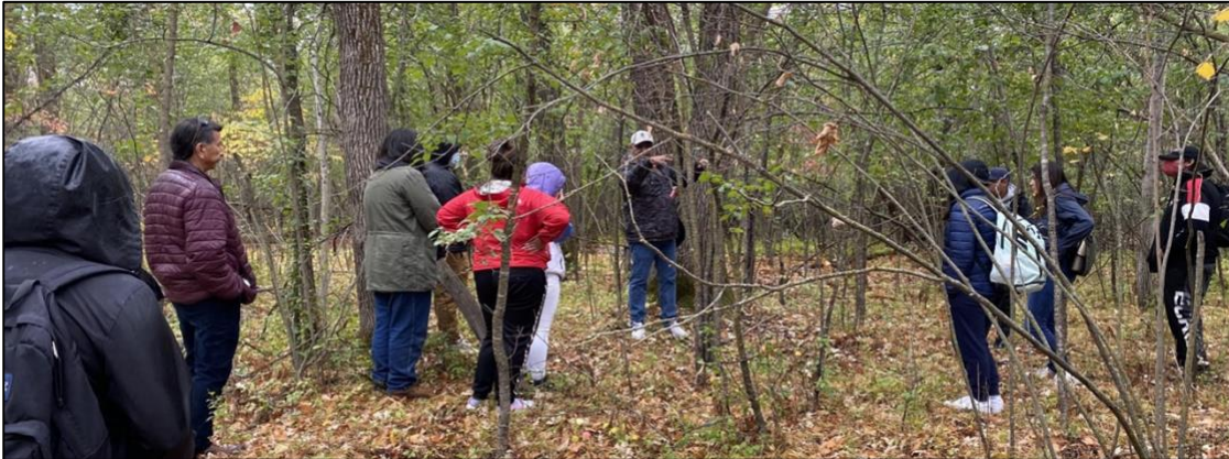
Les élèves le Roving Campus d'une visite Communautaire.

L'un des aspects les plus remarquables — et durables — du concept du Roving Campus et de sa vision faisant de l'ensemble de la communauté sa « salle de classe » est la participation d'une multitude de partenaires communautaires provenant de Portage la Prairie et des quatre coins du Manitoba. Ces partenaires et le rôle qu'ils ont joué dans la réussite du Roving Campus incarnent à merveille le vieil adage selon lequel « il faut un village pour élever un enfant ». Voici une brève liste de certaines des organisations qui ont contribué au curriculum du Roving Campus :