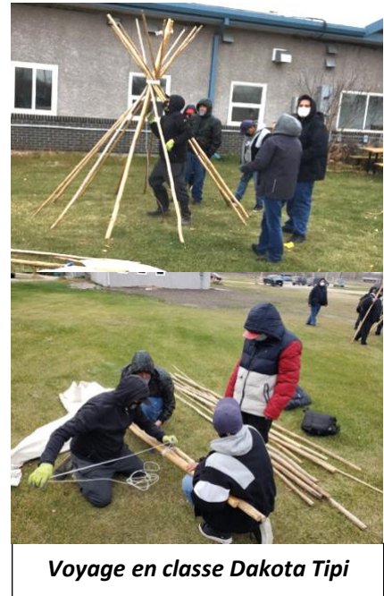
Voyage en classe Dakota Tipi